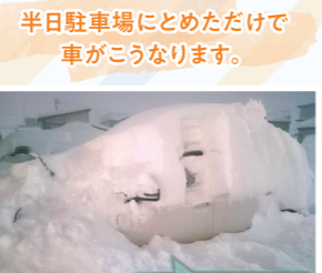
半日駐車場にとめただけで車がこうなります。

地元はあまりに雪が多いので、家の前に「流雪溝」という水が勢いよく流れる側溝が整備されています。そこには雪を捨てられるのですが、日中の1時間限定のため、1日除雪しなかっただけで大変なことになります。