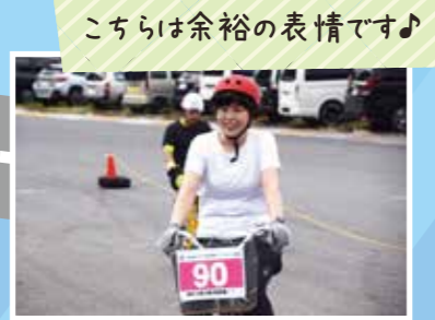
こちらは余裕の表情です♪