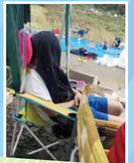
受付組は眠気が限界です...