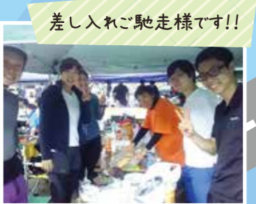
差し入れご馳走様です!!