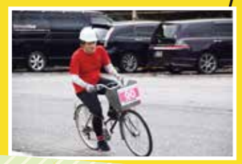
いよいよスタート! この疾走感!