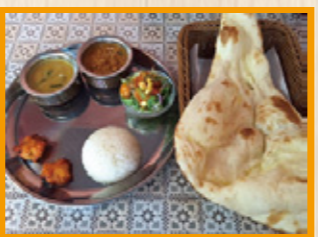
カレー2種類(チキン・野菜・キーマ・本日のカレーの中から選べます)とチキンティッカ、サラダ、ライスと食べ放題のナンがついたBセットは999円

店舗情報【住所】新潟県三条市嘉坪川1-2-32 【ランチタイム営業時間】11:00~15:00 (14:30LO)