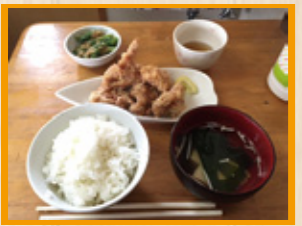
写真は定番のから揚げ定食800円です。

店舗情報【住所】新潟県三条市鶴田3-7-18 【ランチタイム営業時間】11:00~13:30