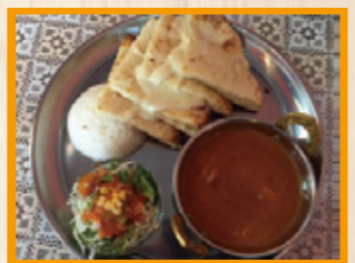
カレー1種類とサラダ、ライス、とろとろのチーズがサンドされたナンがついたチーズナンセットは1,150円 チーズ好きにはたまりません!!