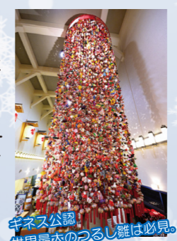
キネス公認 世界最大のつるし雛は必見!

十日町市といえば魚沼産コシヒカリや地酒、絹織物などの名産品に加えて、近年は3年に一度開催されるアートの祭典「大地の芸術祭」の中心開催地としても有名ですね。こちらの道の駅は、十日町の名産品や鮮度抜群の地場野菜が手に入る地域最大のお土産販売スペース、絹織物や工芸品の展示・即売スペース、郷土料理を楽しめるカフェレストランなど十日町の魅力を存分に味わうことができます。冬のレジャーへお出かけの際に立ち寄ってみてはいかがでしょう。