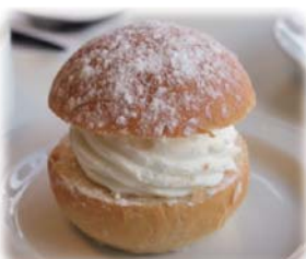
スウェーデンのお菓子Semla(セムラ)

※さわやかで上品な香りを持ち、「香りの王様」と呼ばれるインド原産のスパイス。カレーの主要原料であり、お菓子や他の料理にも広く用いられます。