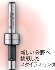
新しい分野へ挑戦したスタイラスセンタ