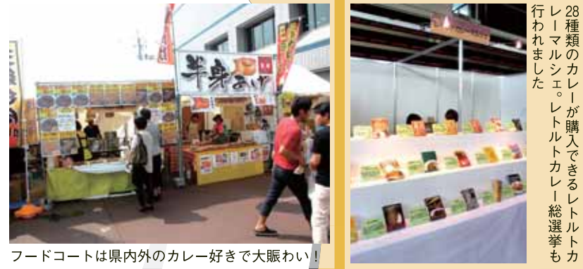
フードコートは県内外のカレー好きで大賑わい!

新潟県民は子供からお年寄りまでみんなカレーが大好き!なんと新潟県はカレーの購入額が日本一のカレー好き県なのです。 新潟とカレー?なんともピンとこない組み合わせかも知れませんが、新潟の名産と言えは「お米」、冬場はとも寒い地域なので身体が温まる香辛料を使った料理が受け入れられたのでは?という説があります。 そう言われると、新潟県民のカレー好きは納得かも知れません。