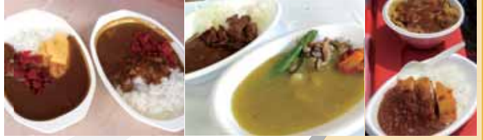
編集部員で10種類のカレーを美味しくいただきました!

新潟精機がある三條は、カレーメン発祥の地といわれています。 会場はスミからスミまでカレーづくしのイベントの様子をご覧ください。 もちろんなこのイベントをカレー好きの編集部が見逃すわけがありません! 市内に約70店舗以上のカレーメニュー提供店があります。また三條市のお隣の燕市では、カレーには欠かせないカレー皿やスプーンなどの洋食器の生産が世界的なシェアを誇る町ということもあり、カレーとは縁の深い地域なのです。 そんな燕市でこのたび二回目となるカレー博が開催されました。