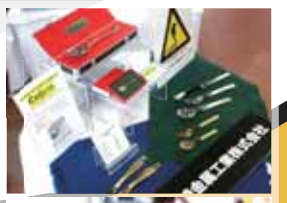
カレーには欠かせない洋食器も多数展示販売