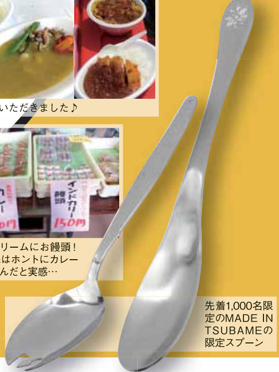
先着1,000名限定のMADE IN TSUBAMEの限定スプーン

28種類のカレーが購入できるレトルトカレーマルシェ。レトルトカレー総選挙も行われました