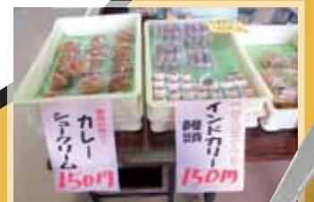
シュークリームにお饅頭!新潟県民はホントにカレーが好きなんだと実感...