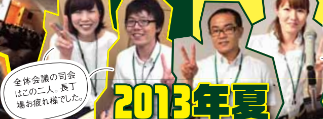
全体会議の司会はこの二人。長丁場お疲れ様でした。