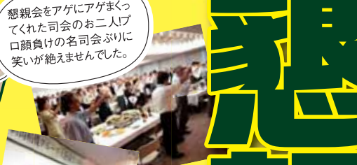
懇親会をアゲにアゲまくってくれた司会のお二人! 口頭負けの名司会ぶりに笑いが絶えませんでした。