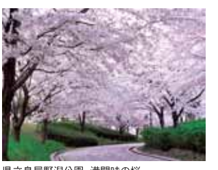
県立鳥屋野湯公園、満開時の桜。

さて、私のお気に入りの桜ポイントですが、新潟市内では“県立鳥屋野湯公園”と鳥屋野湯に架かる“弁天橋”周辺です。満開にもなると、2000本のソメイヨシノが一面をピンクに染め上げ、青空とのコントラストも相まってゴージャスな景色を織りなします。新潟精機のある三条市内ですと、三条市浄水場(三条市民には、もっぱら“水源地”と呼ばれています)がオススメ。ここは我が家から徒歩10分位の所で、桜の本数こそ少ないのですが、満開になると小さな山ひとつが桜色に染まります。場所が浄水場なので普段は立ち入り禁止になっていますが、桜の時期になると期間限定で入ることができるようになります。夜になるとぼつんぼつんとボンボリが灯り、満開の桜が薄明かりに照らされ何とも幻想的な風景が浮かび上がります。お花見スポットという訳ではないのですが、静かに桜を楽しむには持って来いです。 はてさて、今年こそは満開の桜に出会えますでしょうか? ベストタイミングを計るべく、通勤途中も桜が気掛かりな今日この頃です。それでは、皆さんまた次回お会いしましょう〜。